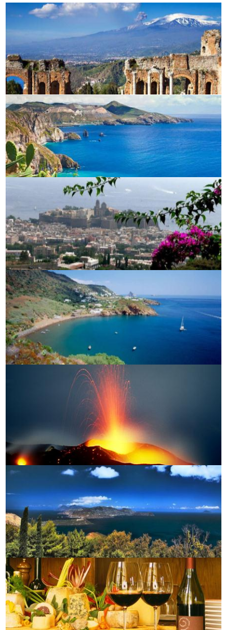
Hotel Baia Portinenti 4*