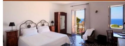
Villa Neri Resort 5*L