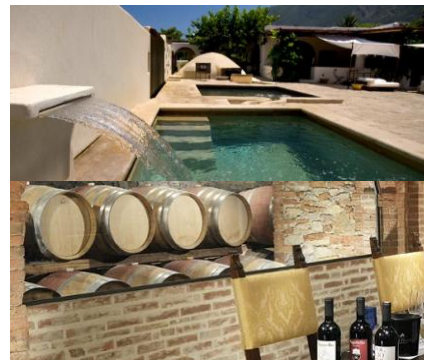
Hotel Signum 4*L